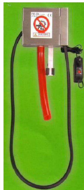
Separatore fe-ol RING