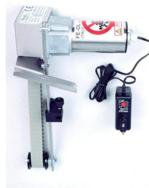
Separatore fe-ol 200

I separatori fe-ol sono dotati di alimentatore bassa tensione con interruttore multi posizione per la regolazione della velocità di lavoro.