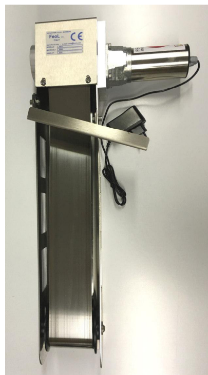
Separatore MAXI fe-ol

fe-ol RING: separatori d'olio dotati di un anello di gomma galleggiante diam. 12 mm, adatti a vasche di macchine utensili come torni, fresatrici, centri di lavoro con vasche contenenti fino a 2000 litri di emulsione. Estrazione olio fino a 2 litri/ora a temperatura ambiente. Grazie all'anello di gomma galleggiante che vaga liberamente sulla superficie della vasca, fe-ol RING copre un'ampia superficie raggiungendo anche zone distanti dal separatore d'olio. Facile applicazione, particolarmente adatti per le vasche posizionate sotto alle macchine utensili ove l'accessibilità è limitata.